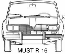
MUST R 16

5 ème Sortie RENAULT 16 européenne Alsace 2013 11 et 12 Mai